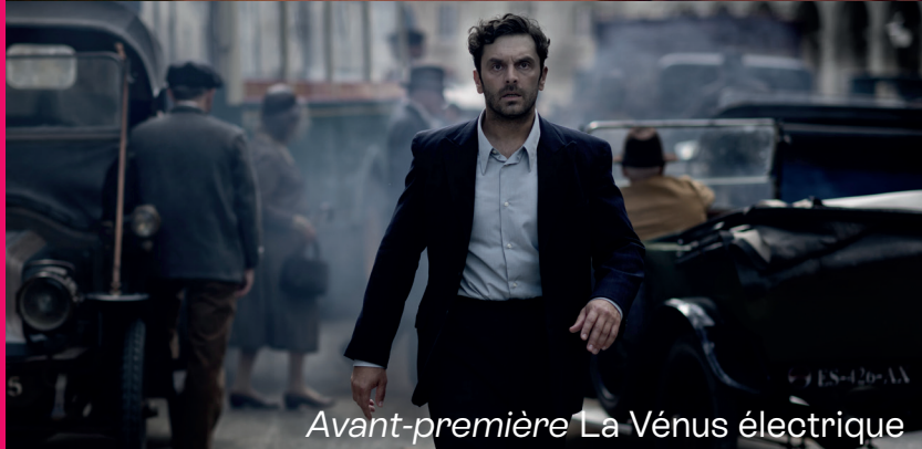
Avant-première La Vénus électrique