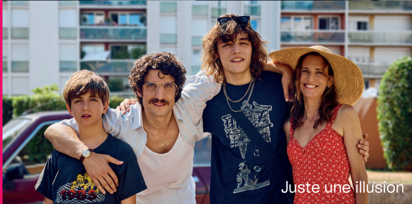
Juste une illusion