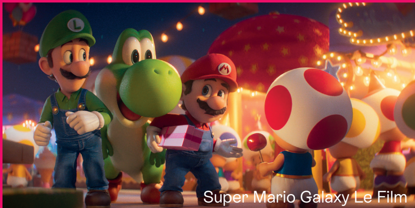
Super Mario Galaxy Le Film